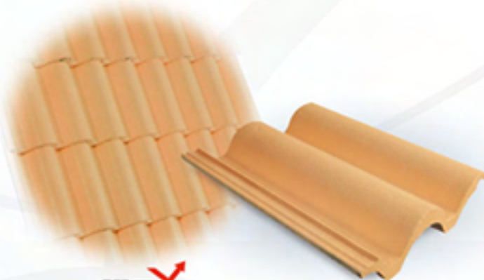
671 ส้ม กลีเซียร์ (Glacier Orange)