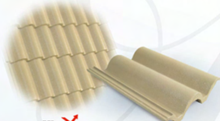
621 น้ำตาล ซิเบเรียน (Siberian Brown)