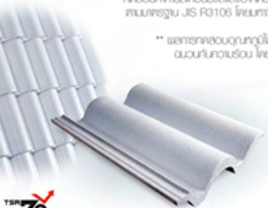
661 เทา ทุนดรา (Tundra Grey)

* Made to order - within 3 weeks delivery after receiving purchase order